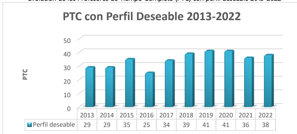
Evolución de los Profesores de Tiempo Completo (PTC) con perfil deseable 2013-2022

Fuente: Departamento de Gestión Académica, UNISTMO 2022, con corte al 30 de septiembre de 2022.