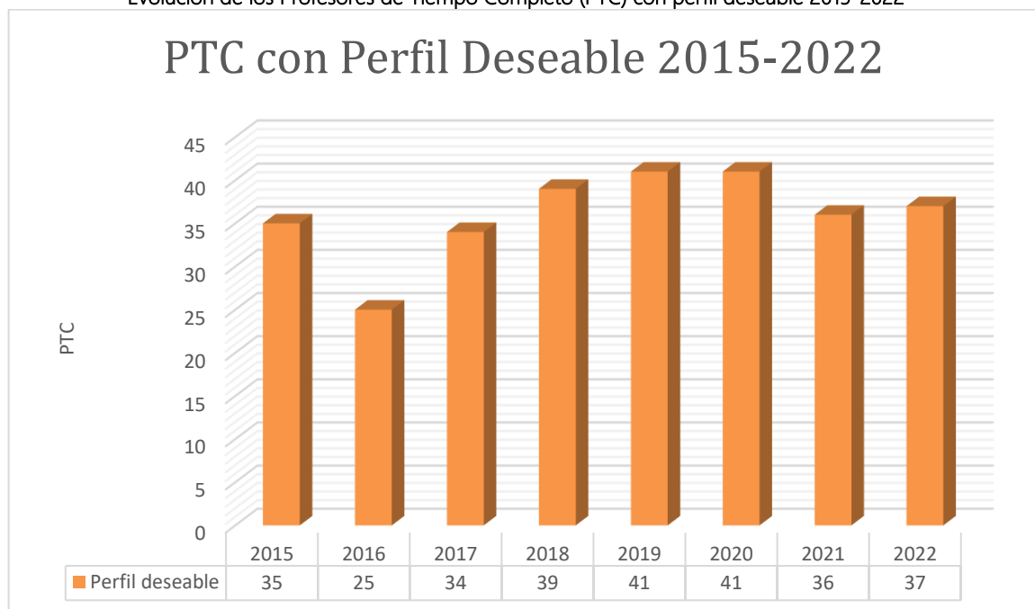
Evolución de los Profesores de Tiempo Completo (PTC) con perfil deseable 2015-2022

Fuente: Departamento de Gestión Académica, UNISTMO 2022, con corte al 31 de diciembre de 2022.