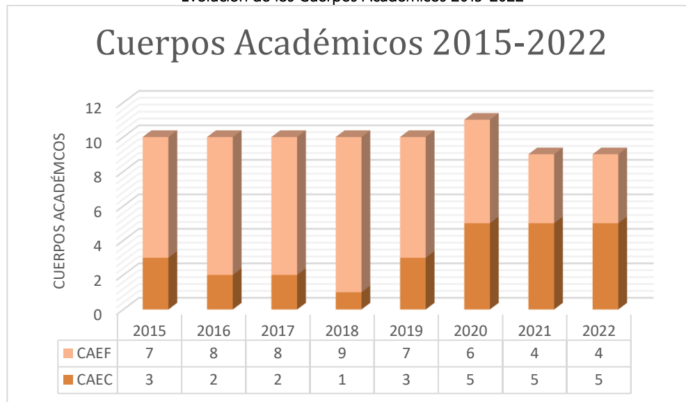
Evolución de los Cuerpos Académicos 2015-2022

Fuente: Departamento de Gestión Académica, UNISTMO 2022, con corte al 31 de diciembre de 2022.