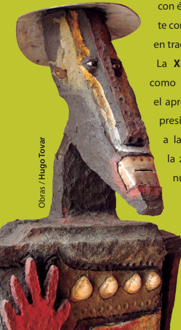
Obras / Hugo Tovar