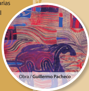
Obra / Guillermo Pacheco

en arqueología por la Universidad de Arizona, Tucson, EUA. Desde 1974 trabaja como arqueólogo-investigador en el INAH. Ha realizado proyectos arqueológicos en Monte Albán, Huamelulpan, Yucuita, Cerro de las Minas y otros. Dirigió proyectos arqueológicos en el Istmo Oaxaqueño. Actualmente analiza materiales (cerámica, lítica, huesos y otros) con el fin de publicar y difundir los resultados de sus investigaciones.