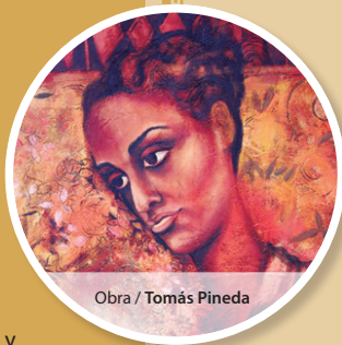
Obra / Tomás Pineda

Originario de Boston, Massachussets, EUA, de naturalización mexicana. Recibió su doctorado en antropología con especialidad