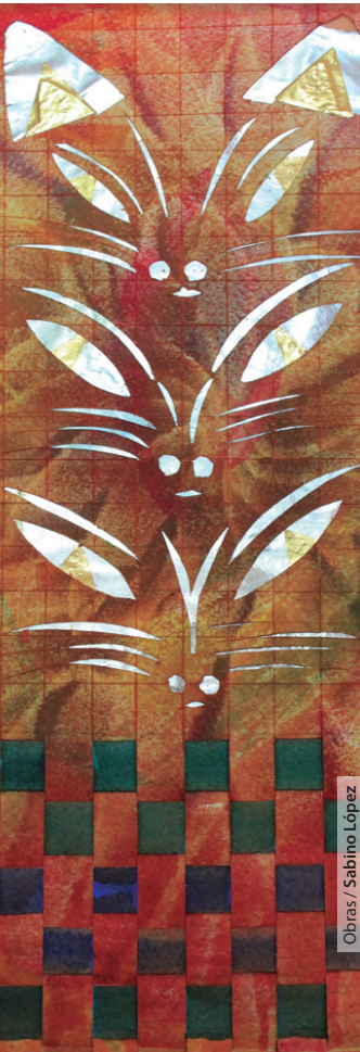
Obras / Sabino López

Originaria de Minatitlán, Veracruz. Su niñez y parte de su adolescencia la vivió en el Istmo de Tehuantepec y desde muy joven mostró talento para dibujar. Egresada de la UABJO. En 2001 comenzó