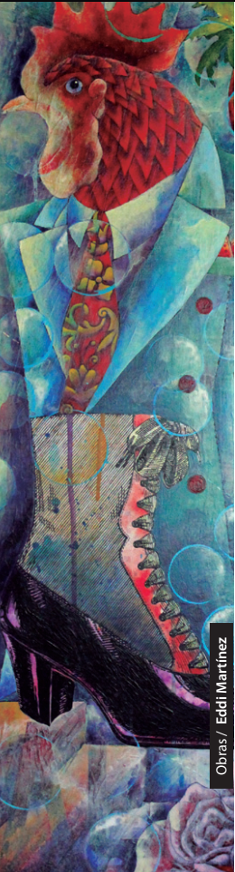
Obras / Eddi Martínez