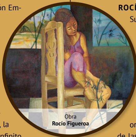
Obra Rocío Figueroa