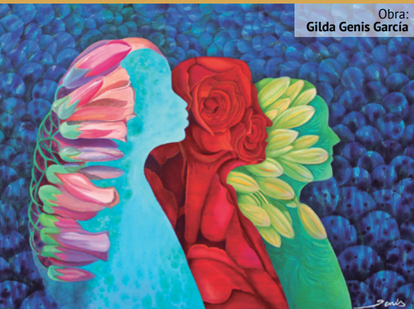
Obra: Gilda Genis García