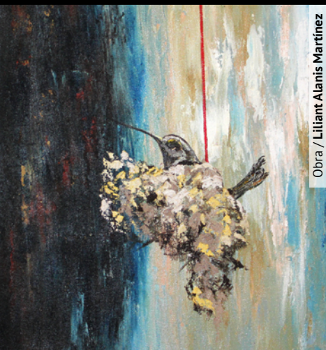
Obra / Liliant Alanís Martínez