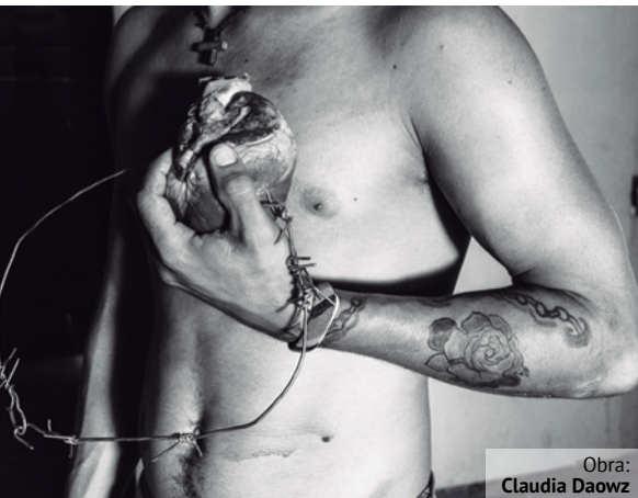
Obra: Claudia Daowz