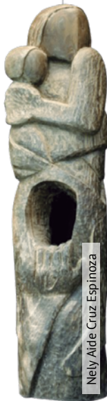
Nely Aide Cruz Espinoza