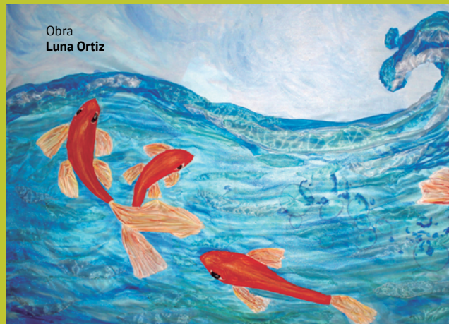
Obra Luna Ortiz